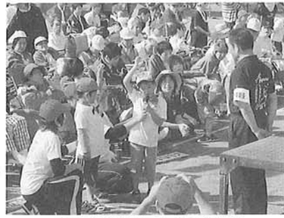
コアラ園の幼児さんに元気良く「選手宣誓」をしてもらいました。