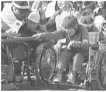
綱引きでは、綱が切れればかりに力いっぱい綱を引きました。

また、昼のアトラクションではめったに見ることの出来ないチアリーディングを、久留米大学チアリーダー部の方々に披露していただきました。