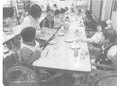
△カニ鍋など料理がたくさんで、おいしかったよ