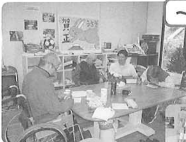
△年賀貼り絵のパーツ制作をしています