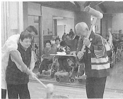
利用者さんも一緒に餅つき大会を楽しみました。

また、昼のアトラクションではめったに見ることの出来ないチアリーディングを、久留米大学チアリーダー部の方々に披露していただきました。