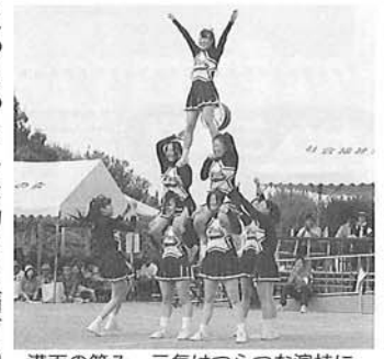
満面の笑み、元気はつらつな演技に、みんなパワーをもらいました。

毎年12月にうきは消防署による夜間想定避難訓練の実施と、うきは地区防災協会の方々による餅つき慰問が行われています。昨年は12月8日(木)に行われました。千歳療護園開設の昭和54年以降、毎年欠かすことなく30年の長きにわたり、継続していただいている事にうきは地区防災協会の皆様をはじめ、うきは消防署の皆様から深く感謝しております。