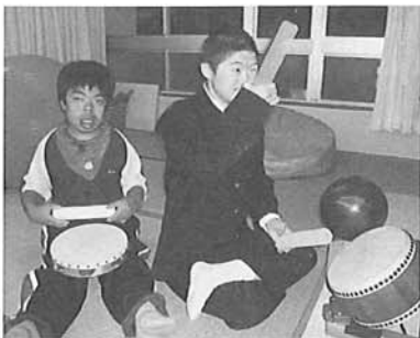
今日も楽しくトントントントントリズムに乗って~トントントント

昨年の11月12日、善導寺小学校で行われた屏水フェスタにみんなが参加し「友・遊・YOU」の歌を披露しました。