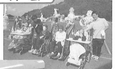
△外出でバサロのかかしとフラダンス