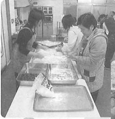
△餅を丸く丸めてます。上手でしょう？