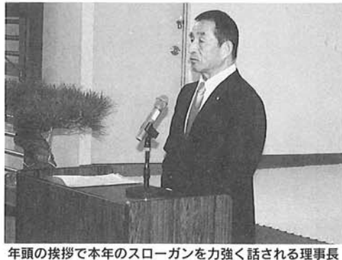
年頭の挨拶で本年のスローガンを力強く話される理事長

平成24年、辰年がスタートしました。年頭に当たり、理事長に所信をお伺いいたしました。