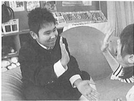
ハイ!! タッチ♪今日も楽しく遊ぼうね(^0^)

この事業は久留米市からの委託事業で、中学生と高校生を対象に放課後の支援をする事業です。昨年5月19日より、毎週木曜日の15時30分から屏水中学校の特別支援教室で行っています。主に歌を歌ったりボーリングや風船バレーをして遊んだり、本人の好むことをして過ごされています。現在、同中学校特別支援学級の2名と、久留米特別支援学校の2名の、計4名の方に利用していただいています。