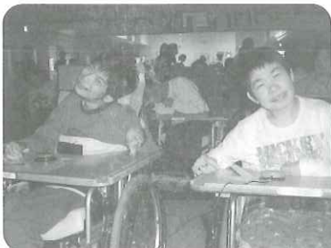
△スイッチたくさん 押せるかな?