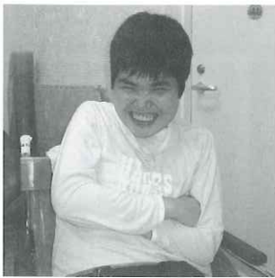
歌を聴いている中にいい顔してました♪

たくさん笑顔が見られます。声を出して笑われたり、体でリズムを刻んだり、手を叩いたり喜ばれる方もいらつしやいます。逆に突然涙を流される方もいらつしやいます。楽しんでもらうことを一番に行っています。普段表出の少ない利用者様にとっては、泣くという表出もストレス緩和に繋がるので、さらに煽ることもあります。