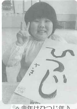
△今年(今年)はひつじ年!