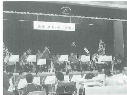
たくさんの素敵な演奏、楽しかったです。

近くまで出てきて、楽しそうに踊ったり大きい声で歌ったり、とても楽しい時間を過ごされました。どうもありがとうございました。