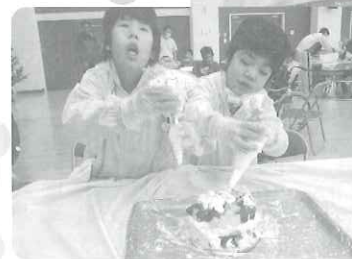
△おいしいケーキ になーれ!