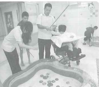
△ゲームコーナー 「かわいい妖怪を釣り上げちゃえ」