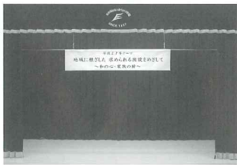
「テーマ」は交流ホールに一年間掲げられています。

「地域に根ざした、求められる施設をめざして」です。社会福祉法人がこれまで培ってきた専門性、地域性を活かして社会に貢献できることは無限であります。地域に求められる施設は、すなわち私たち(利用者・職員)が目指す施設ともいえるので、テーマとしました。