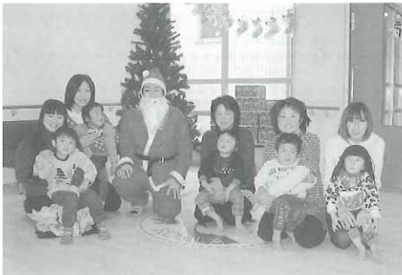
ケーキを持ってきたサンタさんと一緒に「はいチーズ！」

12月15日、西日本新聞民生事業団様よりケーキのプレゼントがありました。いつもより早く来たサンタさんにコアラ園の子どもたちはびっくり