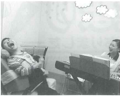
ピアノにあわせて一緒に歌ってま〜す♪

音楽療法とは、心身の障害の回復、機能の維持改善、生活の質の向上などのために、音楽を意図的に使う療法です。音楽は直接情動に働きかけるので、非言語的なコミュニケーション手段として有効であるというところがとても魅力です。