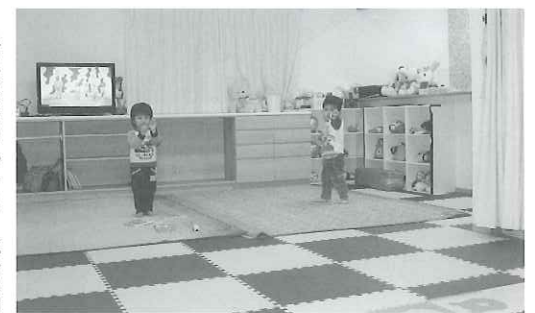
子育て応援宣言の一環、本館棟内にある託児所「こもりぐま」。

福岡県は、企業や事業所のトップが従業員の仕事と子育ての両立を支援する具体的な取り組みを自ら宣言し、それを県が登録する「子育て応援宣言企業登録制度」を、平成15年9月から全国に先駆け実施しています。このほど、その登録企業数が5000社を達成し、その中で特に顕著な成果を上げている宣言企業4社が表彰されるものです。