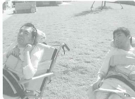
△天気が良くて気持ち良いな~ (^ ^)