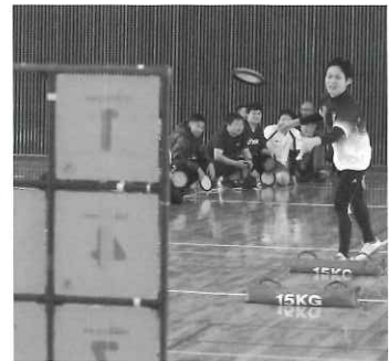
的をよ〜く狙って...ストライク!!