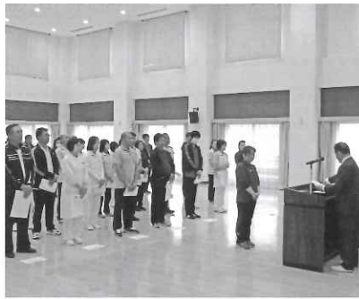
長い間、ご苦労様です。

11月20日、永年勤続の表彰式が行われ、節目の年を迎えられた38名が表彰を受けられました。