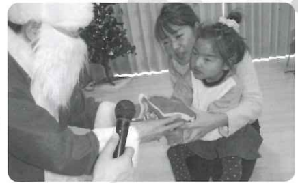
△ ～クリスマス会にて～ 「サンタさんプレゼントありがとう」