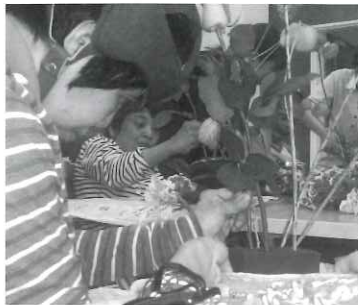
一番綺麗ないけばなを完成させるぞ〜

ゆうかり学園で、いけばな教室の活動を行ってきて17年程になります。いけばな教室で完成した作品を園内には展示しておりますが、外部の方に作品を観ていただく機会はほとんどありませんでした。いつかみな様に、利用者みな様が一生懸命生きたいけばなをご披露できるといういなあとの思いから、今回のいけばな展を開催致しました。また、今年はいくかり学園創設六十周年の記念の年でもあったので、そのような年にも開催することができて、とても嬉しく思っております。