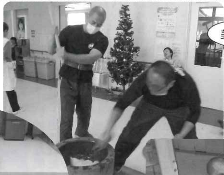
美味しいお餅ができました☆