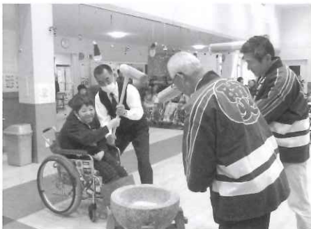
お正月に美味しいお餅を皆で食べましょう!

12月14日に今年で37年目となる浮羽消防署による避難訓練の実施とうきは地区防災協会の方々による餅つき慰問が行われました。利用者の皆様はもちろん、職員も楽しい時間を過ごすことができ、また年の瀬の雰囲気味わうことができました。今年も来て頂いて、ありがとうございます。