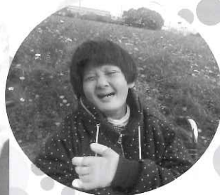
△ 近くのコスモス畑へ。 きれいだったよ～。