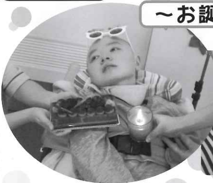
△ 11月の主役は僕だー!!