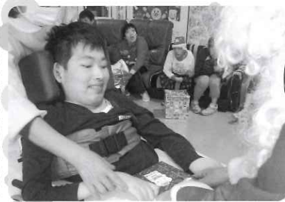
△ プレゼントは何かな?たのしみ～