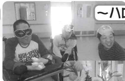
◁ ハロウィンに、 ちなんて変身!