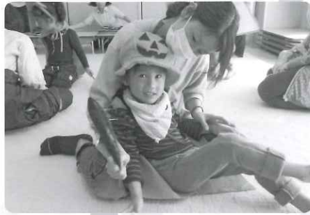
△ ～ハロウィン～ 「お菓子くれないといたずらしちゃうぞ!!!」