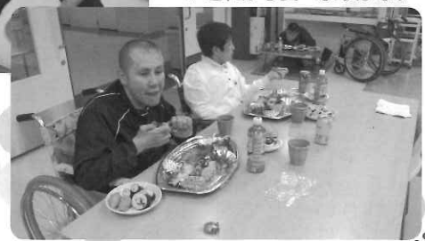
すごいご馳走！！ ▽ どれから食べようかな♪