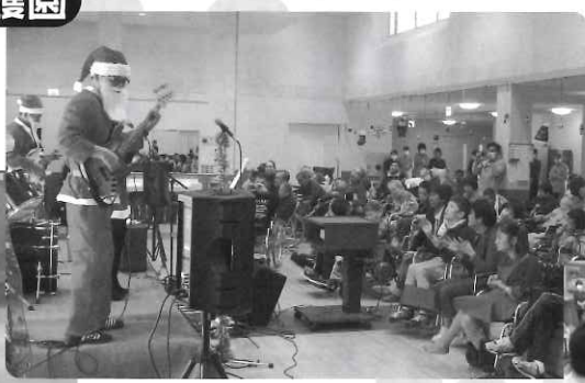
△ 職員による演奏を楽しみました♪