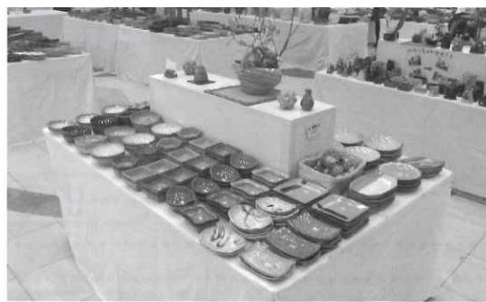
利用者の方が製作された心温まる作品がたくさん並びました。

恒例の展示即売会を1月8〜10日、久留米ゆめタウンで開催致しました。今年は平日を含む期間となりましたが、たくさんのご来場をいただき、心よりお礼申し上げます。本当にありがとうございました。