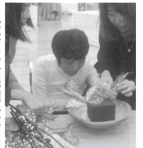
先生にアドバイスをもらって上手に出来るかな？

こだわった点としては、利用者の方々が実際に花を生ける姿を撮影し、会場でのビデオを流し、様子を伝えるようにしました。また、完成したいけばなは利用者の方々と生徒さんとの良さが目立つように工夫しました。