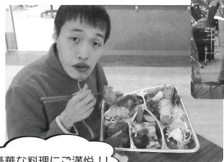
豪華な料理にご満悦！！