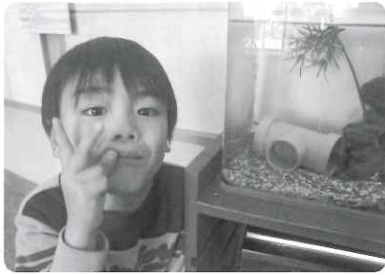
△ ～くるめウスにいきました～ 「おさかないっばい☺」