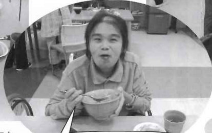
△モツ鍋もちゃんこ鍋もとてもおいしくできました。