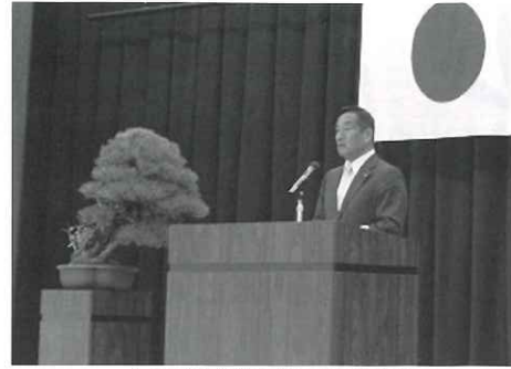
年頭の挨拶をされる理事長

として、本年は、古希に向かつて新たな第一歩を踏み出す重要な年と位置付け、法人や施設の事業運営に取り組む考えであります。