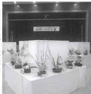
利用者様の綺麗ないけばな

最後に一言お願い致します。これまでの長い期間、いけばな教室が続けてこられたのも、スタッフの皆さんの協力があって、きちんとしたシステムが構築されてきたからだと思います。利用者の方々の楽しそうなお表情を見ると、とても嬉しく、私の張り合いとなっております。今後はいけばなを通して、利用者みな様の笑顔がたくさん見られているように続けていきたいと思っております。