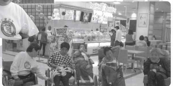
△ お買い物、楽しいなあ。みんなで食べるアイスも格別!