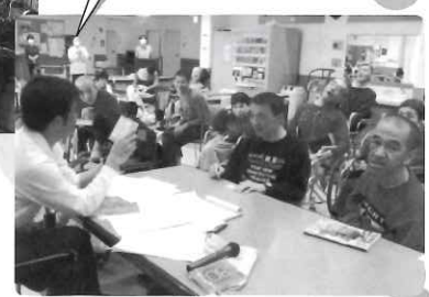
イントロクイズ！！ 皆様必死で頑張りました！！