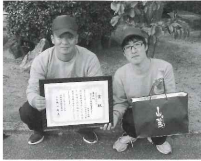
5位入賞、おめでとうございます!

第26回の操法大会は、ゆうかり医療療育センターから屋内消火栓の部に3チーム、千歳療護園から消火器の部に1名参加されました。消火栓の部は18チームが参加し、ゆうかりからは1チームが5位入賞をされました。消防員、観客から注目を浴び緊張感がある中での入賞、おめでとうございます。