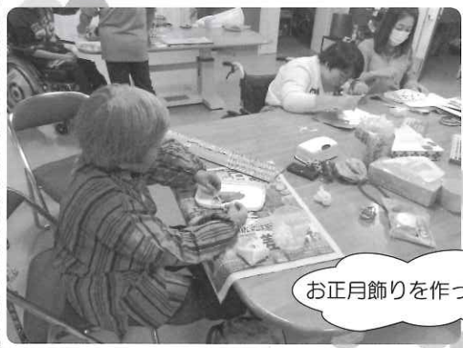
お正月飾りを作ってます