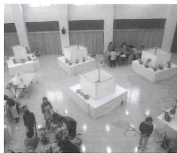
会場には多くのお客様に来て頂きました。

一言で言うとうと、想像以上でした。特にご案内などはしていませんでしたが、利用者や保護者の方々に、さらには地域の方々までたくさん観に来て下さって、非常に驚きました。恐らく、総勢200人以上が観に来られたのではないかと思っています。