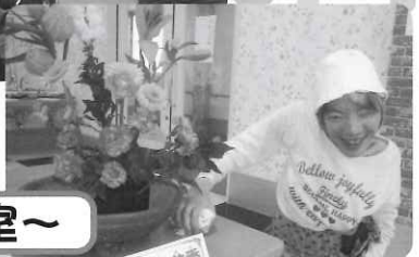
◁ 上手くできました。