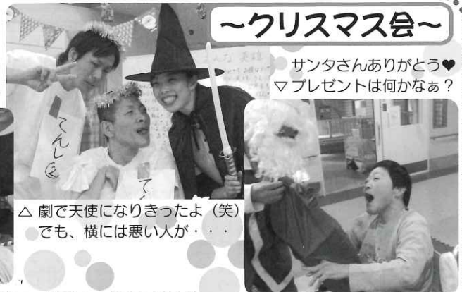
サンタさんありがとう♡ マプレゼントは何かなあ?