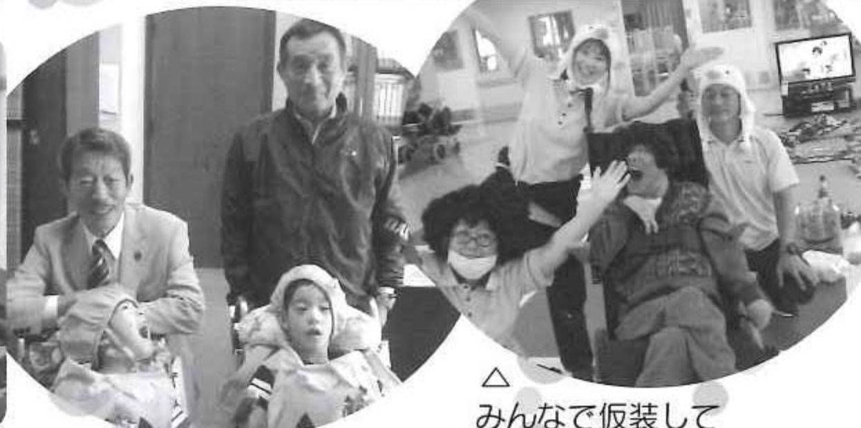
△みんなで仮装して ボーリングを楽しみました! いっぱいお菓子をもらいました(^o^)