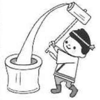
△ つきたてのお餅 おいし～♪。