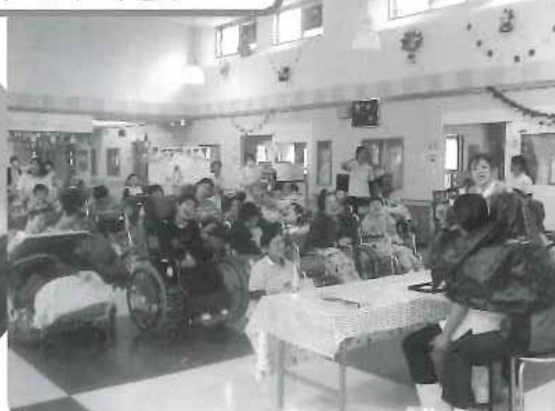
△職員の演芸会にて みんな大笑い(^v^)/A/V/V/V!