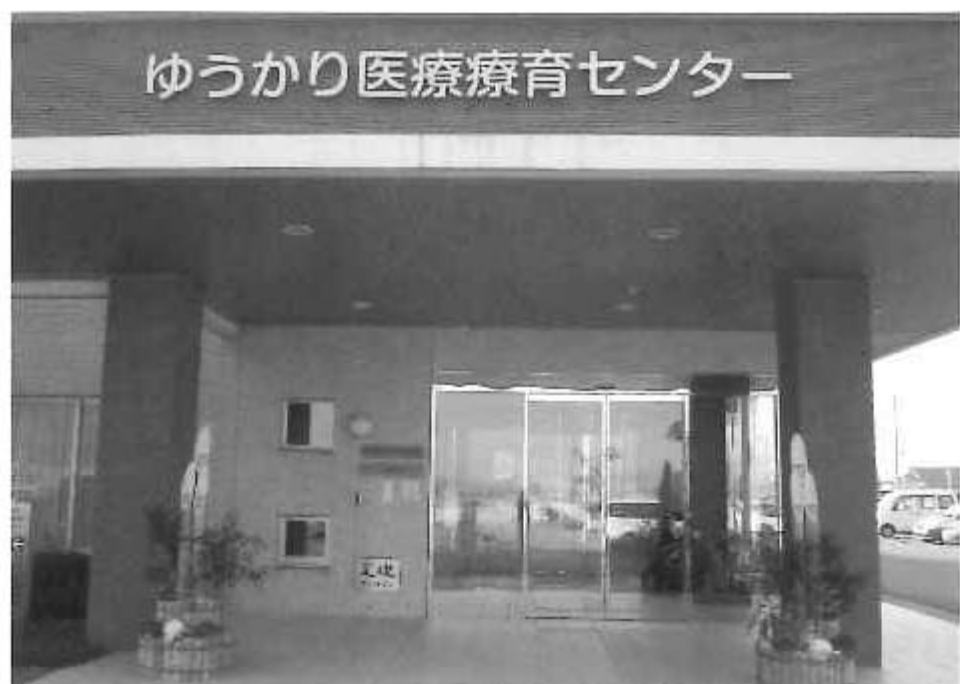
今年も新たな一年のスタートを切りました。