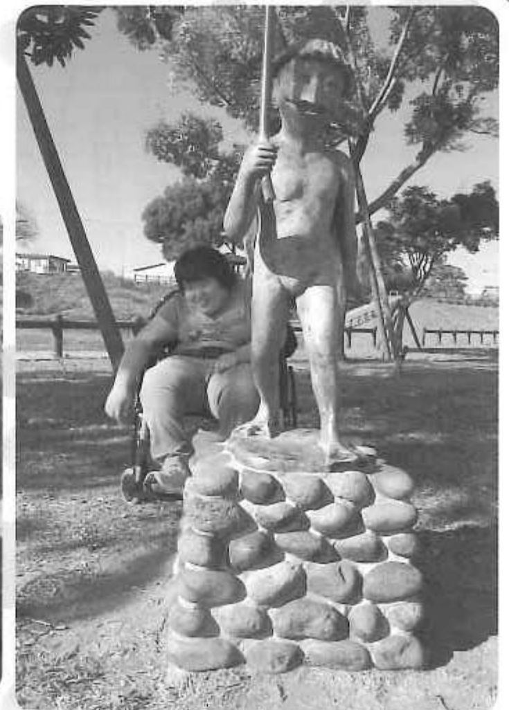
△ 気持ちの良い天気によかった