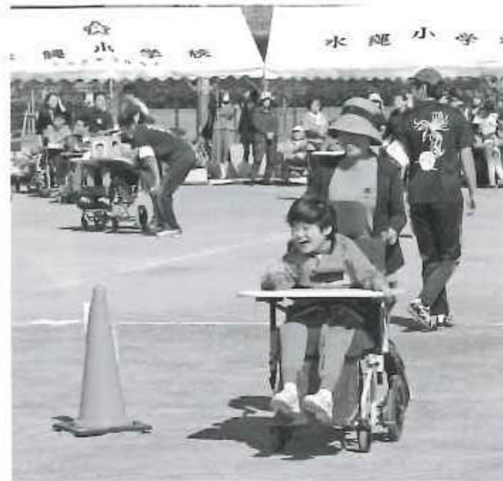
皆から注目されて緊張するなー!!

10月13日、ゆうかり学園大運動会を久留米市東部運動公園にて開催致しました。今年