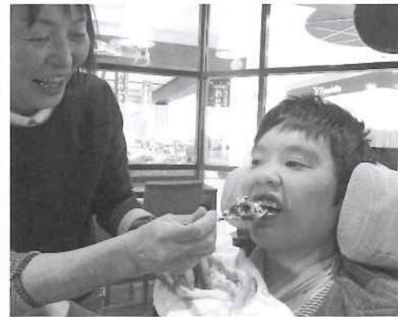
美味しいものをいっぱい食べました♪.

現在、一人年間で1~2回程度行っていますが、できればもっと増やしていきたいと考えております。