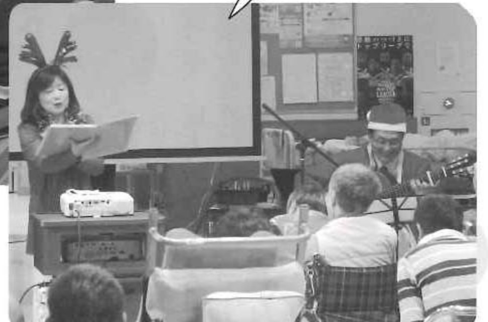
夕やけ座の方に来て いただきました。 素晴らしい語りと歌声 に魅了されました!!