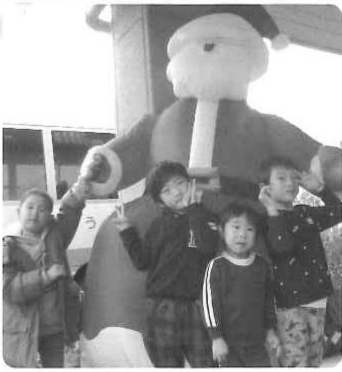
△大きなサンタさんみつけたよ!!