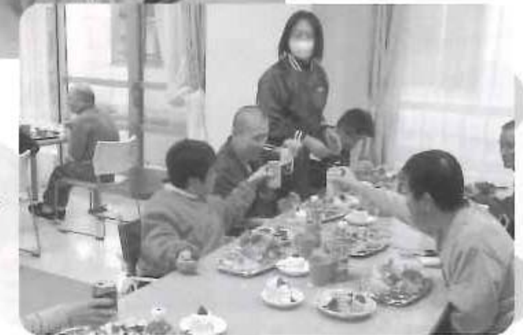
▷ がんばーい! 今年も1年お疲れさまでした。