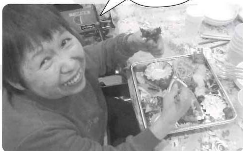
豪華な料理を見て思わず笑顔がでました!!