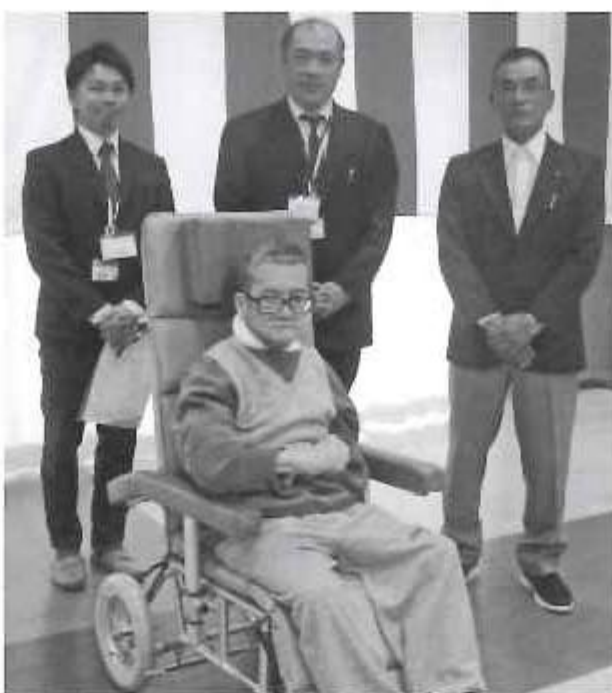
とても座り心地がいいです。

平成30年11月27日(火)に福岡トヨペット販売店(甘木)担当の方より、フルリクライニング式の車椅子を寄贈して頂きました。