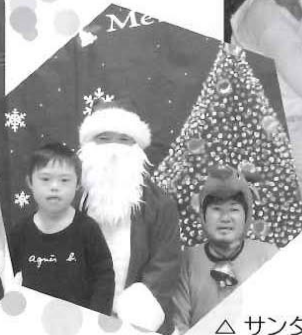
△サンタさんプレゼントありがとう♡