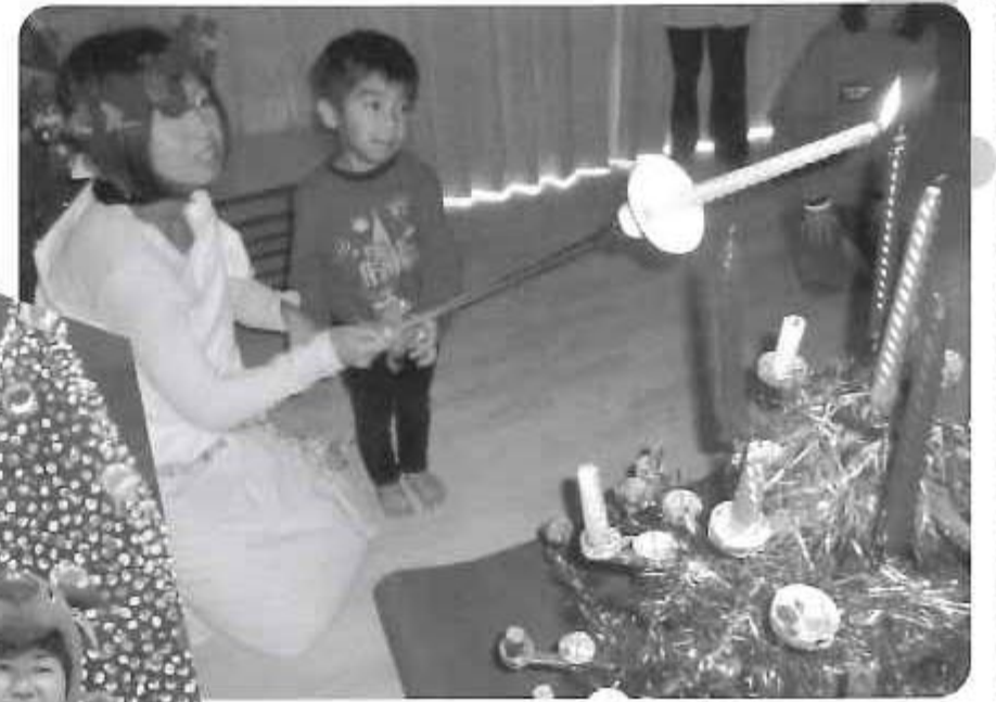
△女神さまと一緒に・・・