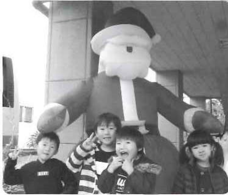
△メリークリスマス☆