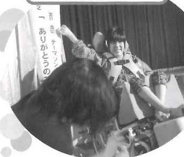
△11月3日は支援学校にて文化祭でした。 全校生徒で合唱コンクール!!