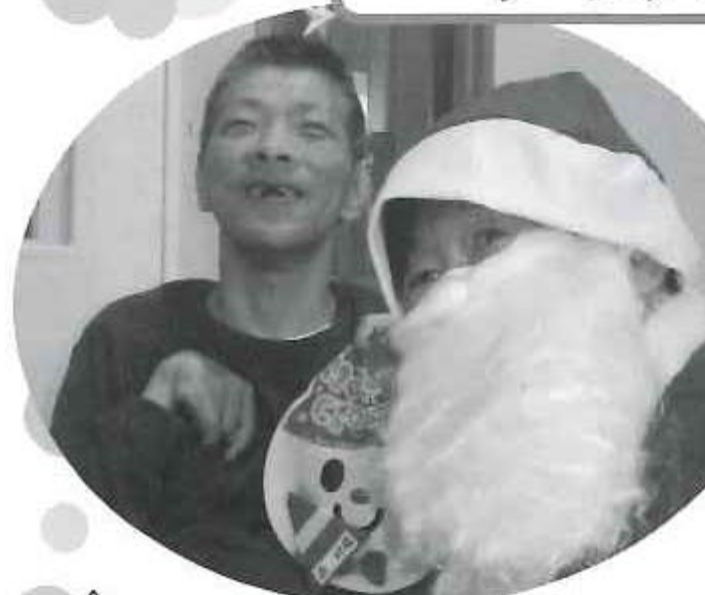
△サンタさんからのプレゼント 届いたよ～!!中身は何か?