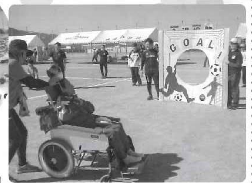
△運動会がんばりました!