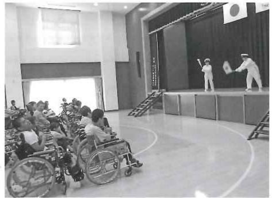
楽しい時間をありがとうございました。