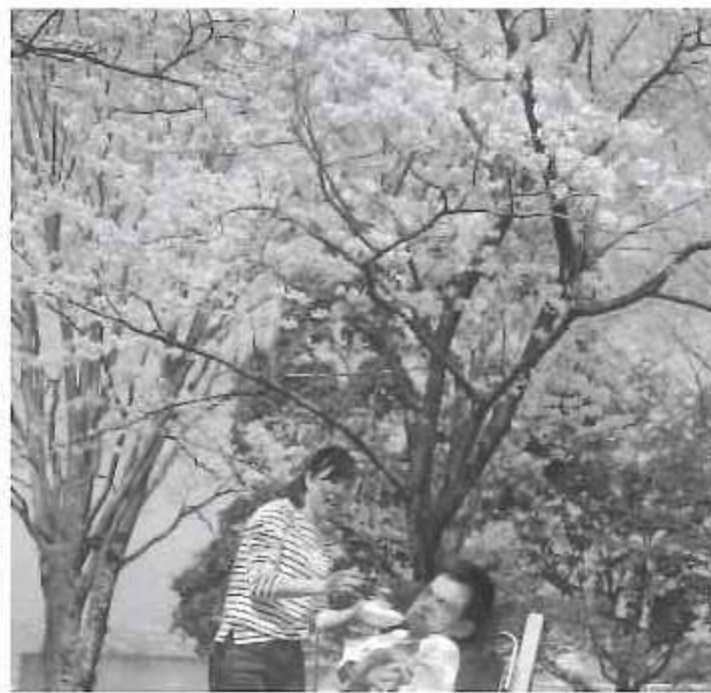
花見をしながら、お・や・つ♡