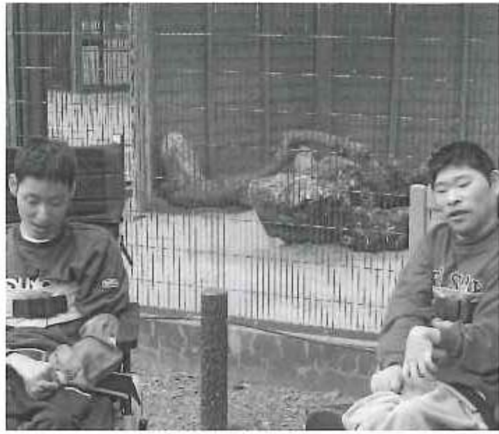
鳥類センターにて・・・フクロウと記念撮影!!

普段、施設内で過ごすことの多い利用者様にとって、外出が一番と言っても過言ではないほどの楽しみとなっております。普段できないことや、買えない物、食べられない物などを自由に自分のお小遣いで購入して頂き、利用者様の気分転換、及び社会体験を目的として行っています。