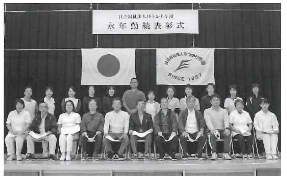
長い間、ご苦労様です。

留米で開催致しました。一つひとつ味のある作品が並び、お楽しみいただけたと思えます。期間中は多くのお客様にご来場いただき、誠にありがとうございました。