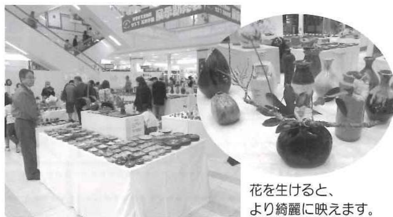
花を生けると、より綺麗に映えます。

留米で開催致しました。一つひとつ味のある作品が並び、お楽しみいただけたと思えます。期間中は多くのお客様にご来場いただき、誠にありがとうございました。