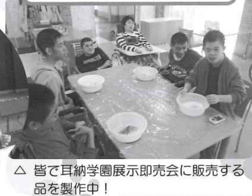
△皆で耳納学園展示即売会に販売する 品を製作中!