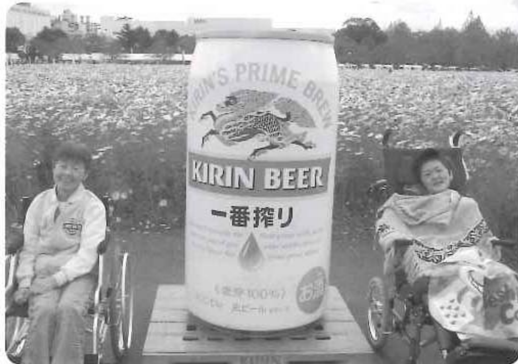
◁ コスモスがきれい