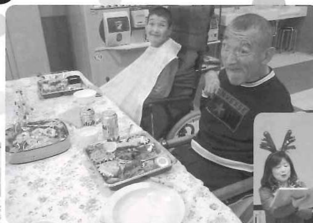
△ 今日は思う存分飲むぞ!!