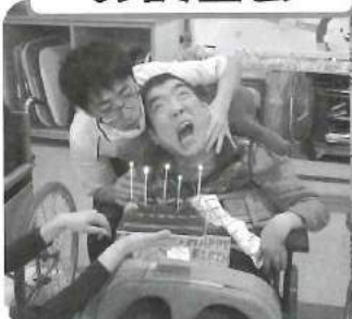
△ ハッピーバースデー!! 早くケーキ食べたいなあ～