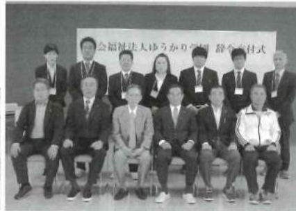
辞令交付式後に新人職員と理事長、園長たちと記念撮影。今年からよろしくお願い致します。

4月2日、辞令交付式と第1回目の新人職員研修があり、17名が研修を受けました。研修では、事務局長による講義から始まり、自己紹介、車椅子実技、施設見学と緊張感を感じるとともに、充実した研修になったことと思います。