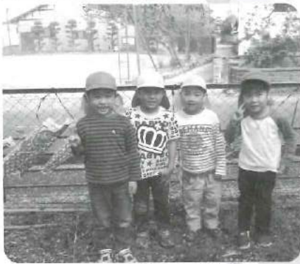
△ こいのぼり、みつけたよ