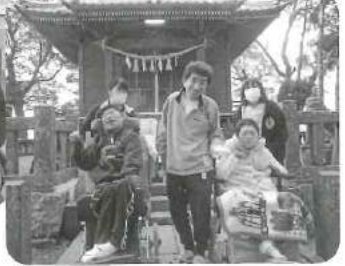
△ 神社に立ち寄りみんなで参拝し ました!! 願いは叶うかな?