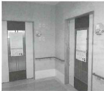
ここが典心の湯への入口です。

典心の湯は、毎週水曜日と土曜日の13時～18時まで利用できます。ただし、年末年始やお盆、祝日及び法人都合による休日があります。また、現在は60代前半～80代後半までの52名の方が入会されており、一日当たり約30名の方が利用されています。