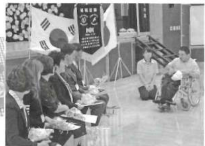
歓迎セレモニー 유카리학원에 오신 것을 환영합니다. (ようこそお越しくださいました!)