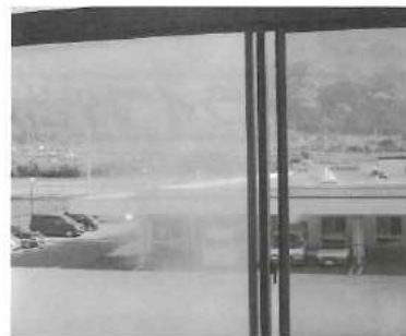
典心の湯からの眺めは絶景です！！。

「典心の湯を利用されているの感想をお願いします。(お客様)」 一番はお湯が良いことです。湯加減もそうですが、温泉の質も良いように感じます。また、幅広い年齢層の人たちと知り合い、農業の話や趣味の話など色々学べることも多く、とても幸せな時間を過ごすことができますので、毎回利用する日を楽しみにして来ています。