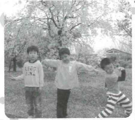
△ 桜の前でハイポーズ!