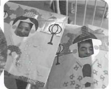
△ お内裏様とお雛様♪