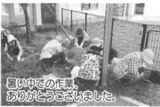
園内の除草作業をしていただきました。暑い中での作業、ありがとうございました。

後は温泉に入り、昼食を食べさせていただきました。おかげさまでとてもきれいになり、職員、利用者の方々もより清々しい気持ちで過ごすことができると思います。