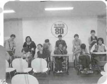
△ 選手達が試合終わりに記者 会見する所で記念撮影! ドーム内にもたくさんの 部屋がありびっくりしました。