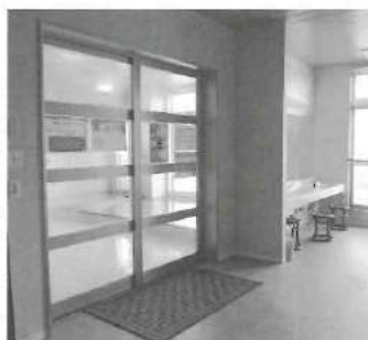
典心の湯 温まった後はこの脱衣所で一息。

「典心の湯を利用されているお客様の反応はどうですか。近所に住まれている方々は、他の温泉施設よりも3分の1の時間で来ることが出来るので非常に便利で嬉しいと言われています。また、湯加減も良いので、もう一日利用できる日を増やして欲しいと言われるほど非常に喜んでおられます。」