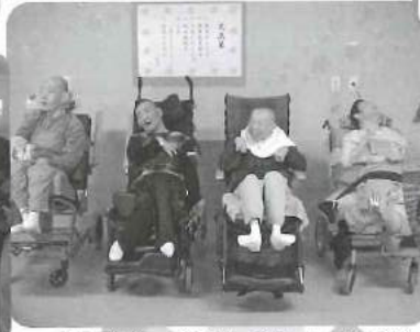
△ 修了式へ参列しました(^O^)