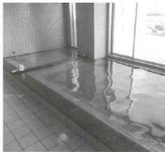
典心の湯 湯船はこんな感じ～♪。