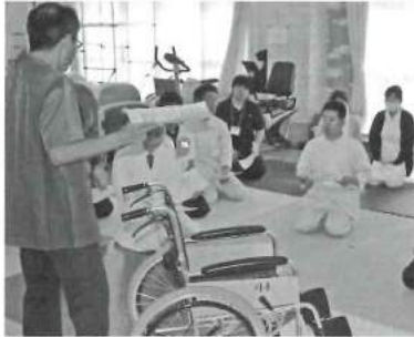
新人職員研修の一場面。訓練部から車椅子操作についてのお話がありました。

4月20～23日は韓国瑞林福祉院より6名が来園され、23～26日は当法人より5名が瑞林福祉院を訪問し、とても有