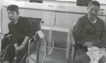
△ 福岡空港まで外出。 飛行機たくさん見れて 良かったなあ♪