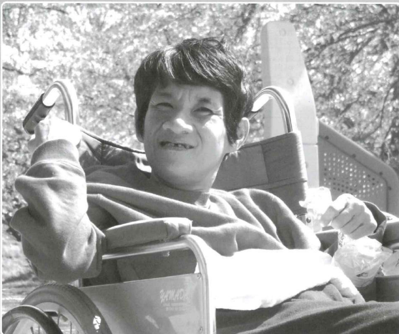
桜も笑顔も満開です。