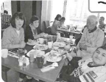
△ ヒルトンホテルでバイキング!! たくさんおいしいもの食べれて お腹いっぱいになりました。