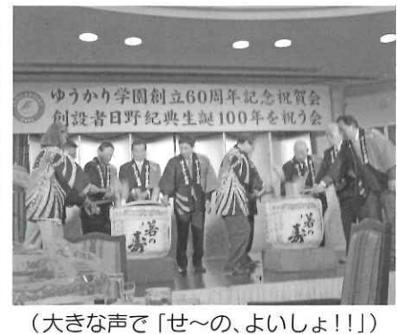
(大きな声で「せ~の、よいしょ!!!」)

どんな心でしたかが大切である」という創設者の言葉を胸に刻み、地域福祉の拠点としての役割を果たすべく努力をしてまいり所存でございます。これまでの60年のご厚情に深く感謝申し上げますと共に、今後益々のご指導、ご鞭撻のほどをお願い申し上げます。ご挨拶とさせていただきます。