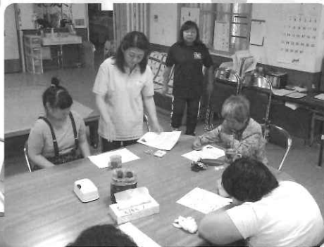
△ さあ、今月の歌を歌いましょう