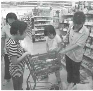
まずは買い物から。皆で考えながら食材を購入しました。

自立支援の一環とした調理教室を目的としています。現在は学童児を対象とした夏休みの行事の一つとして実施しています。材料の買い物から始まり、料理を作ることを体験します。できることは限られることもありませんが、自分たちで作った料理を食べる時の笑顔はひとしおです。学童児にとって楽しみながら貴重な体験です。