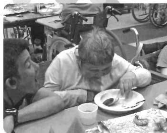
△ 焼きたての バーベキューは 美味しかったです。