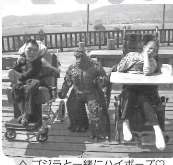
△ ゴジラと一緒にハイポーズ♡