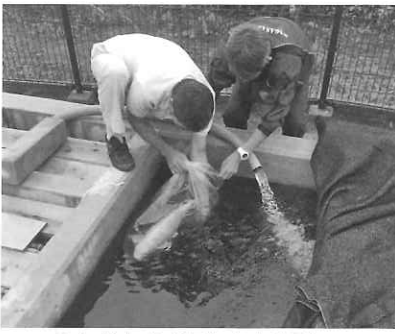
みんな大きく育ちますように。

利用者様のご家族を通して、錦鯉をいただけるお話があり、60周年の記念事業のひとつとして、職員で力を合わせて池を作りしました。みんな仲良く元気に泳いでいます。ぜひ見に来てください。