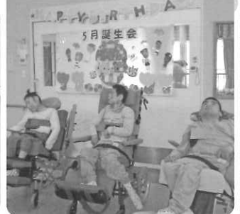
△ お誕生日 おめでとうございます(^O^)