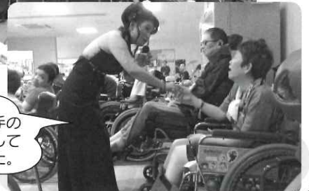
納涼祭で歌手の 方に握手をして もらいました。