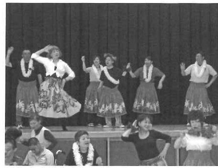
豪華な衣装を身につけてとてもステキでした。

に来ていただき、楽しい踊りの披露と沢山のお菓子やお餅のプレゼントをいただきました。ニューバージョンの踊り、とってもおもしろかったです。本当にありがとうございました。