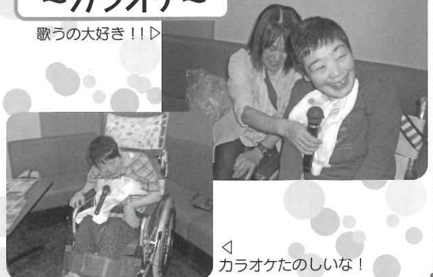
◁ カラオケたのしいな!