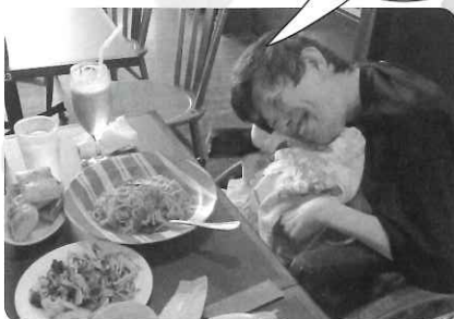
買物外出で 美味しいものを たくさん食べました。