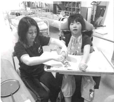
△ 上手できるかなあ