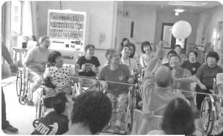
△ 男性チーム vs 女性チーム!! 風船バレーで勝負! みんな真剣です。