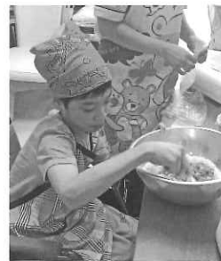
具材を合わせてコネコネより美味しくなるように愛情も込めます。