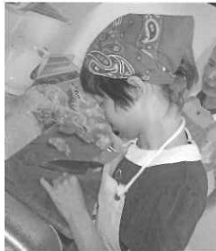
包丁を使って、上手に調理できています。いい経験ができた!!

他に、買い物外出やボウリング、カラオケに行きたいという意見が出ました。その一方で、もう一度調理教室をやりたいという意見が複数出ました。