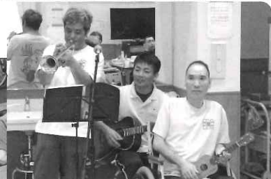
◁ 職員による演奏が 行われました