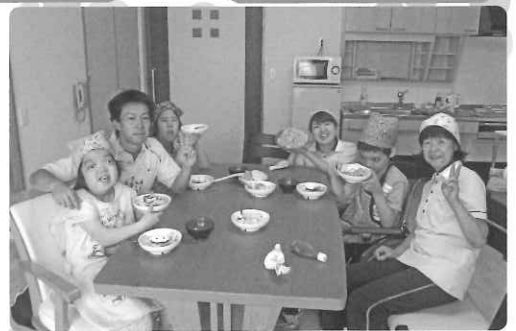
△ 夏休みに調理教室をして、おいしくいただきます。