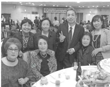
(懐かしい仲間もそろいました。)