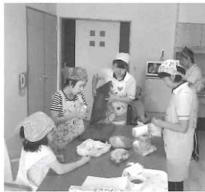
さあ調理実習開始！ 今日のお昼ご飯は何を作るのかな～。楽しみ!!

ことはあります。調理教室で、ナポリタンやポテトサラダを作ったのでスタップと一緒に食材を包丁で切ったり炒めたりという動作に興味をそそり、眼が輝いて嬉しそうにしています。また、普段ゲームばかりしていた利用者が楽しそうにシユウマイを包んだり、オムライスの上にケチャップではなくマヨネーズをかけた様子を見て新たな発見ができました。