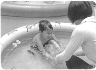
△ プールあそび楽しいな トルンルン♪