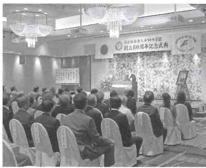
(式典で挨拶される理事長)