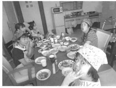
完成!! 皆で美食。自分たちで作ったご飯は、またいつもと美味しさが違ったのではないのでしょうか？

調理教室以外には買い物外出に行き、自分で欲しいものを選びそれを自分で購入するというところを行っています。また、園内ではできる範囲で洗濯や歯磨きの準備等身の回りのことを自分でして頂いています。入浴時では、自分で洗体ができるよう、スタップが横について見守り、声掛けを行っています。