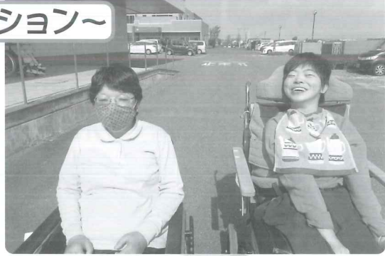
△ 今日はいいい天気