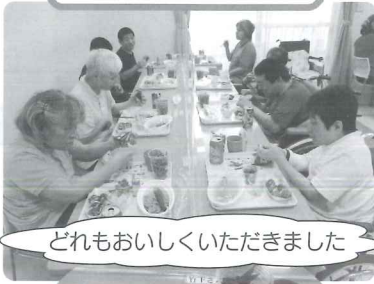
どれもおいしくいただきました