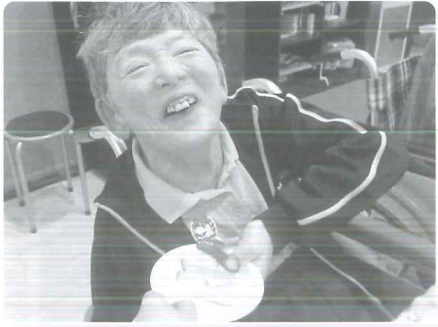
△ ケーキは大好きです。