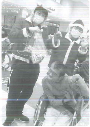
△ サンタがやってきました！！