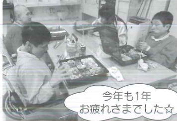
今年も1年お疲れさまでした☆