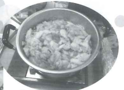
△ 貝だくさんのちゃんこ鍋