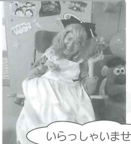
いらっしゃいませ