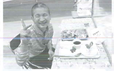
▷ 今年を締めくくると笑顔で一枚