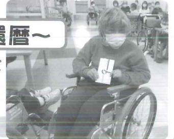
おめでとうございます 、(^o^)