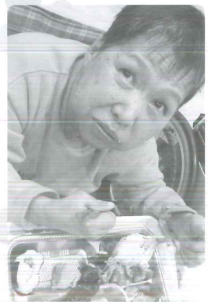
△ 豪華なお料理を美味しくいただきました！！