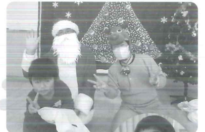
△ サンタさんとハイポーズ