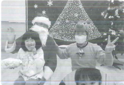
△ サンタさんに会えてうれしい♡