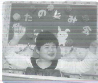
△ お楽しみ会楽しい♪