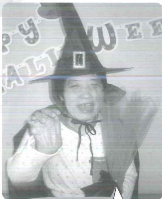
イタズラしちゃうぞー!