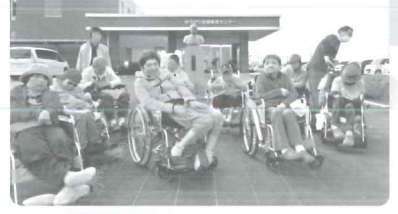
▷ ほかほか陽気で、ゆうかりウォークラリー☆