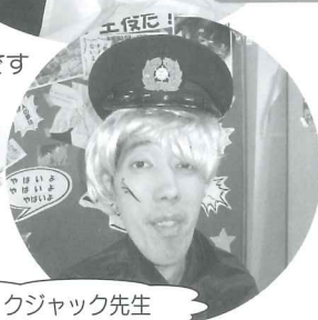
ブラックジャック先生