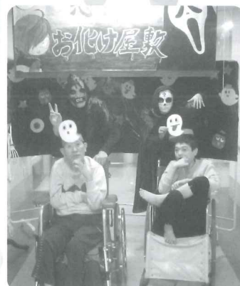
△ おばけ屋敷へようこそ