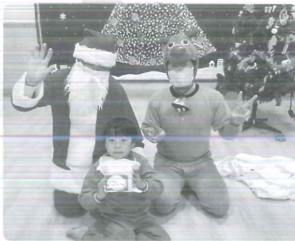
△ プレゼントもらったよ!!