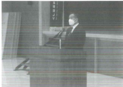
理事長より労いの言葉をいただきました。