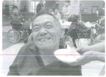
△ ケーキを後で食べます。