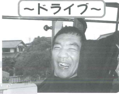
△ドライブ外出月 嬉しいルンルン 良い笑顔*