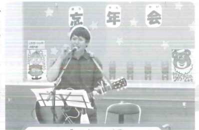
▷ 歌や踊りで忘年会を盛り上げて頂きました！