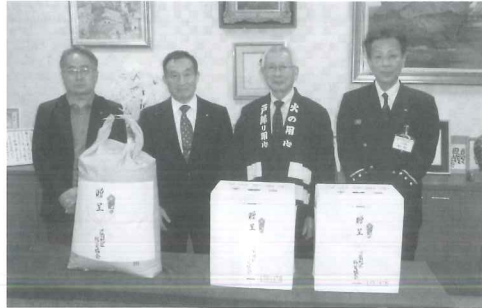
今後とも防犯意識をより高め、皆が安心した生活を送ることができるように努めていきます。

12月9日に浮羽消防署様、浮羽地区防災協会様より餅米とみかんをいただき、贈呈式が行われました。例年行事をさせていただいていますが、昨年からコロナ禍のため、このような形とさせていただきます。大変な御厚意をありがとうございます。