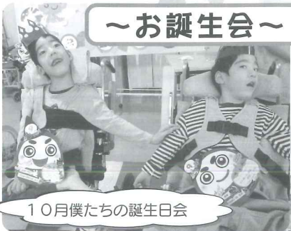
10月僕たちの誕生日会