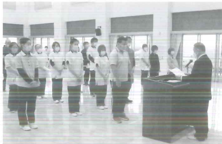
長い間、お疲れ様です。今まで培ってこられた経験を是非教えていただけたらと思います。これからもよろしくお願い致します。