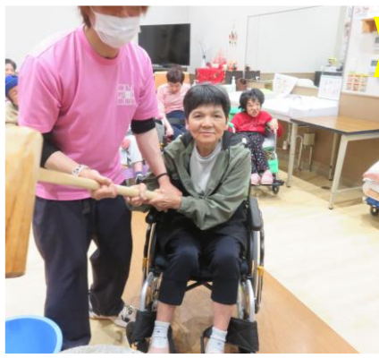
つきたてのお餅おいしかった！(^.^)!