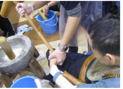
お餅をついてるよ！