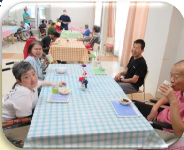
↑ロシアルーレット↑ シュークリーム