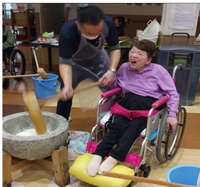
いただいたお餅は皆で楽しく餅つきをして、美味しくいただきました♪

12月4日、うきは地区防災協会様、浮羽消防署様より、みかんともち米をいただきました。いただいた物は、有難く美味しくいただきました。大変貴重なものをありがとうございました。